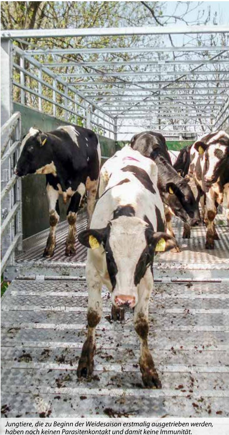
Jungtiere, die zu Beginn der Weidesaison erstmalig ausgetrieben werden, haben noch keinen Parasitenkontakt und damit keine Immunität.

Bei der Aufstallung im Herbst ist es ratsam, die Rinder mit einem Endektozid gegen Magen-Darm-Würmer und Ektoparasiten (z. B. Räude, Läuse) zu behandeln.