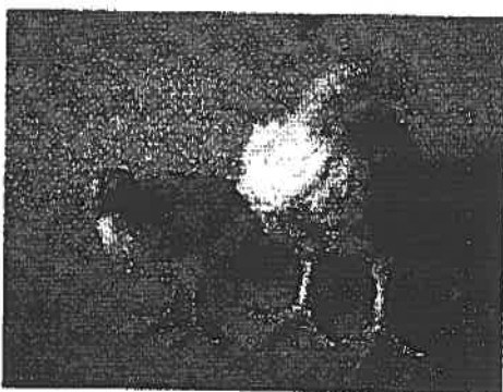
Abb. 3: Größenvergleich zwischen Junghenne (links) und Masthuhn mit 29 Tagen

Die Tierverluste während der Mast in der Praxis liegen bei Masthühnern bei 5 – 7 %, bei Putenhennen bei ca. 4 % und bei Putenhähnen sogar bei 10 % 36 . Zu den Leistungsbedingten Gesundheitsproblemen gehören vor allem Herz-Kreislaufkrankungen (z.B. plötzlicher Herztod und Bauchwassersucht bei Masthühnern, Aortaruptur bei Puten), Erkrankungen des Skelettsystems (z.B. die Gelenkerkrankung tibiale Dyschondroplasia, TD), sowie Muskelerkrankungen (Myopathie der tiefen Brustmuskulatur) 37 . Skelett und innere Organe können mit dem rasanten Muskelwachstum nicht Schritt halten. Die Zucht auf übergroße Brustmuskeln hat zu einer Verlagerung des Körperschwerpunktes bei Puten und Hähnchen geführt, wodurch diese unsicher laufen. Verschiedene Praxisstudien zeigten Häufigkeiten der TD bei Masthühnern von 55 bis zu 90 % 38 und akuter Lahmheiten zwischen 2 und 33 % der Tiere 39 . Die Beinschäden (vgl. Abb. 4) sind oft schmerzhaft, so ergaben Versuche, dass sich Masthühner oder Mastputen mit Zugang zu Schmerzmitteln mehr und schneller fortbewegten 40 . Ein großes Tierschutzproblem in der Intensivmast von Hähnchen oder Puten sind auch schmerzhafte Entzündungen an den Fußballen.