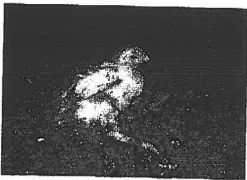
Abb. 4: Masthuhn mit Beinschäden

auf über zwei Drittel der Tageszeit 42 . Darüber hinaus ist die Fortbewegung oft beeinträchtigt. Das lange Liegen auf der feuchten, Ammoniakhaltigen Einstreu begünstigt die Entstehung von Hautveränderungen (z.B. Brustblasen). Die genannten Tierschutzprobleme steigen linear mit der Wachstumsintensität verschiedener Herkünfte an 43 . Ganz ähnliche Probleme bestehen bei den Mastputen, welche auch auf die gleichen Ursachen zurückgeführt werden können. Aufgrund des enormen Wachstumspotentials müssen Mastelertiere restriktiv gefüttert werden; anderenfalls würden sie viel zu groß, worunter die Fruchtbarkeit stark leiden würde. Da die Tiere in der Folge hungrig sind, kommt es zu verschiedenen Verhaltensstörungen der Nahrungsaufnahme. Putenhennen werden heute ausschließlich künstlich besamt (in den Zuchtbetrieben), um ein Verletzen der Putenhennen durch die viel schwereren Hähne zu verhindern.