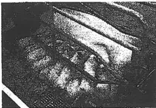
Abb. 2: Sau mit großem Wurf

Die Anzahl abgesetzter Ferkel pro Sau und Jahr ist ein wirtschaftlich sehr wichtiger Parameter für den Tierhalter. Er konnte kontinuierlich gesteigert werden, zunächst durch eine Verkürzung der Säugedauer, später durch eine züchterische Steigerung der Wurfgrößen. 2011 wurden im Mittel 26,5 Ferkel je Sau und Jahr abgesetzt bei 2,34 Würfen im Jahr 27 . Die Ferkel werden heute im Durchschnitt nur noch 3 – 4 Wochen gesäugt, so dass die Sauen mehr als zweimal im Jahr werfen. Die kurze Säugezeit belastet die Tiere, da weniger Zeit für die Rückbildung der Gebärmutter besteht, was Fruchtbarkeitsstörungen begünstigt. Ferner sind die früh abgesetzten, leichten Ferkel anfälliger. In den letzten Jahren wurden die Wurfgrößen züchterisch stark gesteigert (s. Abb. 2), z.B. durch die Verwendung von Hybridsauen aus Dänemark, den Niederlanden oder Frankreich. Die Sauen werfen heute oft schon mehr Ferkel, als sie Zitzen haben (durchschnittlich nur 7 Zitzenpaare vorhanden), so dass überzählige Ferkel aufwändig künstlich aufgezogen werden müssen. Ferner nimmt aufgrund der begrenzten Gebärmutterkapazität das Geburtsgewicht des einzelnen Ferkels mit zunehmender Wurfgröße ab, wodurch die Ferkelverluste ansteigen (Unterkühlung, Erdrücken) 28 .