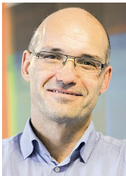
Gregor Veauthier Elite-Redaktion

D er technische Fortschritt macht auch vor dem Kuhstall nicht halt: Jedes Kaugeräusch, jede Bewegung, jede Liegephase einer Milchkuh, ja sogar jeder Anstieg oder Abfall des Trächtigkeitshormons Progesteron lässt sich heute in Echtzeit erfassen. 24 Stunden am Tag, sieben Tage die Woche. Mit einer App lassen sich die meisten Daten mittlerweile mit dem Smartphone abfragen: im Stall, auf dem Acker, in der Küche oder selbst von einem anderen Kontinent aus!